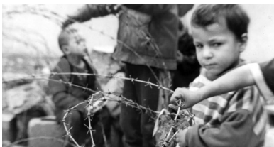
Kinderen in Irak

Omdat het meestal gaat over mensen op de vlucht voor een oorlog, worden deze mensen vaak oorlogsvluchtelingen genoemd. Net als bij het statuut van erkend vluchteling heeft niet zomaar iedereen op de vlucht voor oorlog recht op subsidiaire bescherming: oorlogsmisdadigers worden niet beschermd.