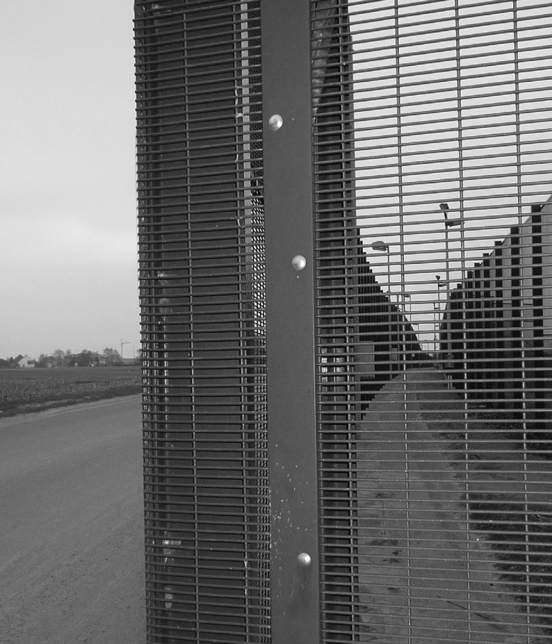
Gesloten centrum 127bis, Steenokkerzeel