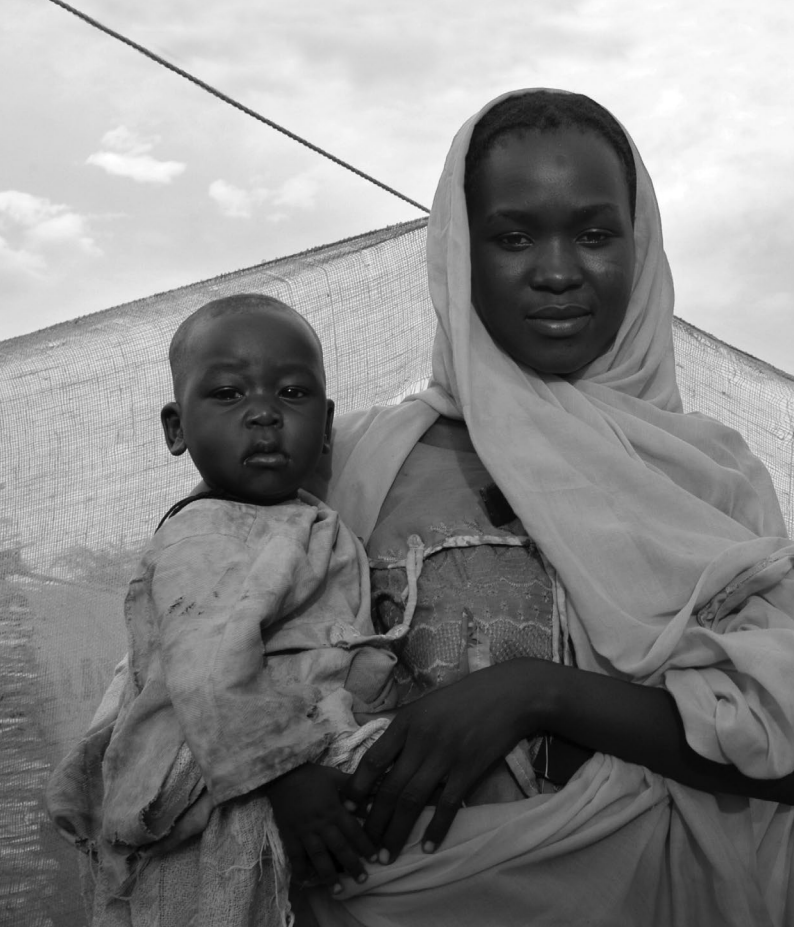
Een vluchtelingenfamilie in het kamp Goz Amer, Chad