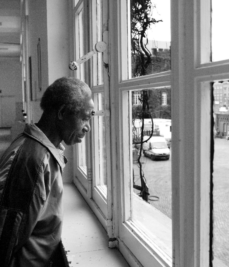
Asielzoeker in opvang van Fedasil, Klein Kasteeltje, Brussel © Marcel Van Colie, 2008