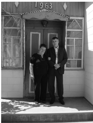
Vrijwillige terugkeerders (Rusland)

Het Europees verdrag voor de Rechten van de Mens en het Anti-Folterverdrag bepalen immers dat een land niemand mag terugsturen indien er een risico bestaat op een vernederende of mensonterende behandeling of straf zoals foltering of