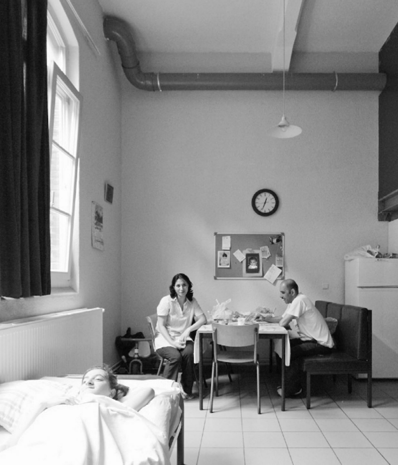
Asielzoekers in opvang van Fedasil, Klein Kasteeltje, Brussel