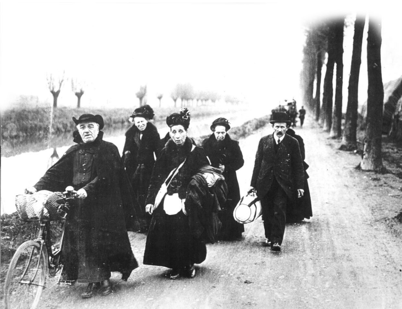
Vluchtelingen in België tijdens de uittocht, 1940

Zoals eerder vermeld is niet iedereen die zijn land verlaat een vluchteling. Hoe wordt dan bepaald of iemand in aanmerking komt om beschermd te worden als vluchteling?