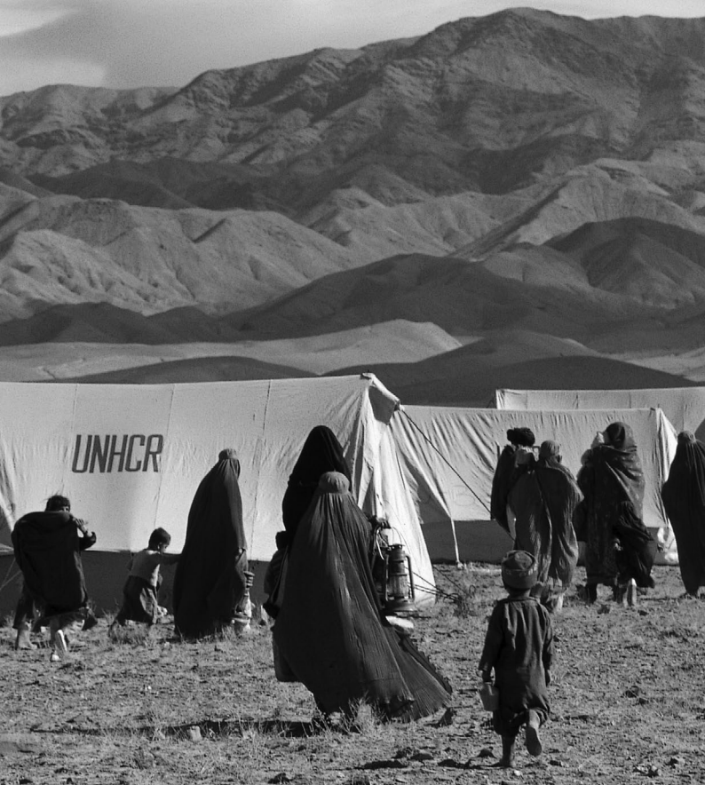
Afghaanse vluchtelingen - Roghani kamp, in de buurt van Chaman, Pakistan. © UNHCR, P. Benatar, december 2001